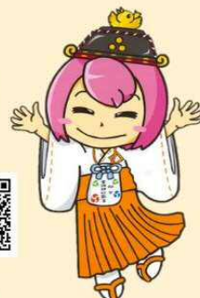
室根神社特別大祭 PRキャラクター みこシスターズ シーちゃん